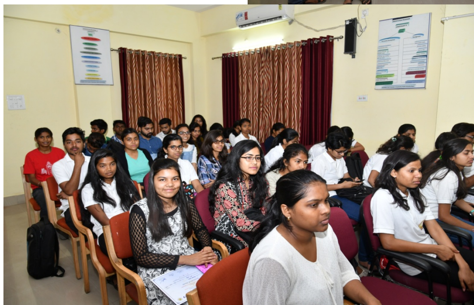
Date 18/03/2019: Valedictory & Prize Distribution @ HRDC Seminar Hall, PRSU Raipur