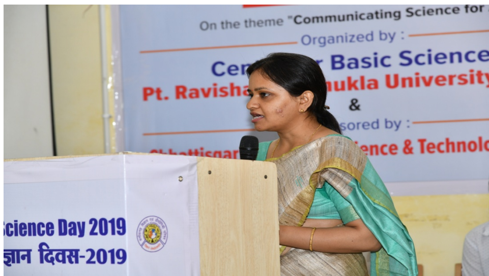
Date 18/03/2019: Valedictory Function @ HRDC Seminar Hall, PRSU Raipur