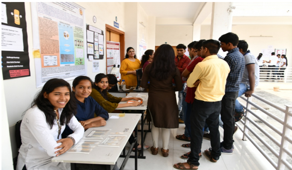
Date 18/03/2019: Model Making Competition @ Center For Basic Sciences, PRSU Raipur