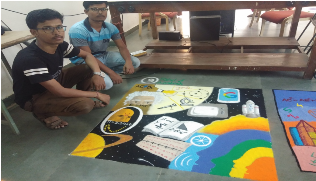
Date 18/03/2019: Rangoli Competition @ Center For Basic Sciences, PRSU Raipur