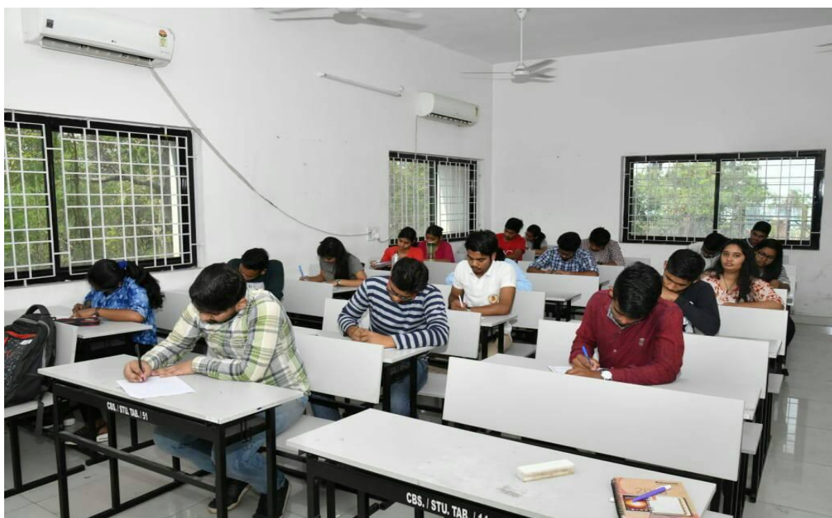
Date 12/03/2019: Essay Writing Competition @ Center For Basic Sciences, PRSU Raipur