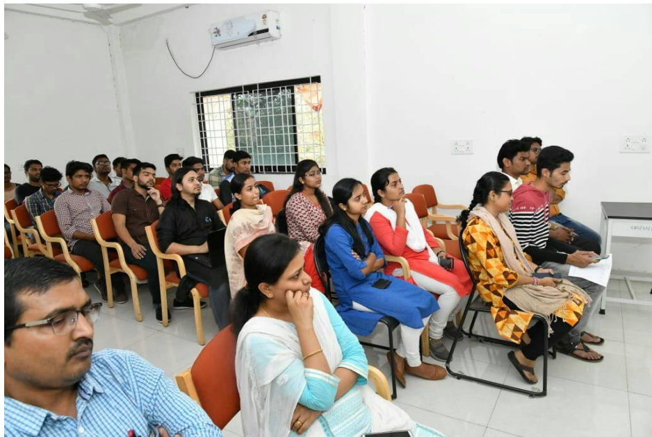
Date 12/03/2019: Debate Competition @ Center For Basic Sciences, PRSU Raipur